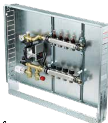
Variante 6 Vertikal mit Pumpengruppe PUSH-23 Verteilerbalken mit Pumpen-Beimischgruppe PUSH-23, mit Festwertregelset, Anschluss 3/4", vertikal