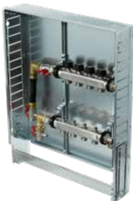
Variante 3 Vertikal mit WMZ Verteilerbalken mit Wärmemengenzähler- Anschlussset 3/4", Anschluss vertikal