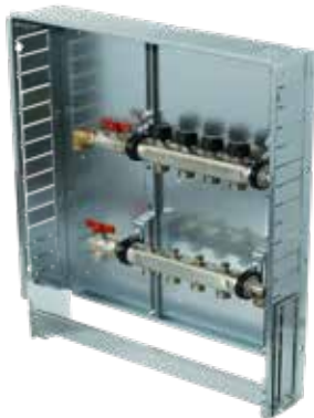
Variante 1 Vertikal ohne WMZ Verteilerbalken mit Kugelhahn 3/4", Anschluss vertikal