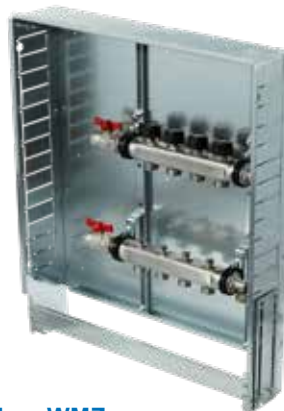
Variante 2 Horizontal ohne WMZ Verteilerbalken mit Kugelhahn 3/4", Anschluss horizontal