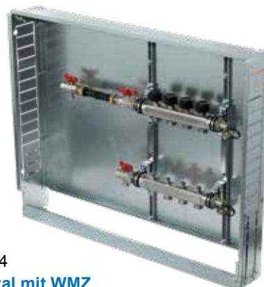
Variante 4 Horizontal mit WMZ Verteilerbalken mit Wärmemengenzähler- Anschlussset 3/4", Anschluss horizontal