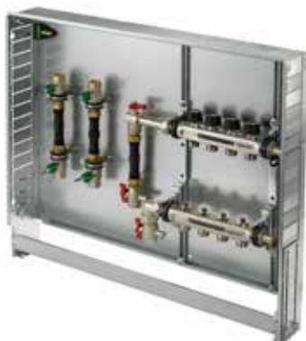
Variante 5 Vertikal mit WMZ und Wasserzähler-Passstück Die Passstücke für Kalt- und Warmwasserzähler sind in der Verteilerstation integriert und für den Einbau aller marktüblichen Zähler geeignet